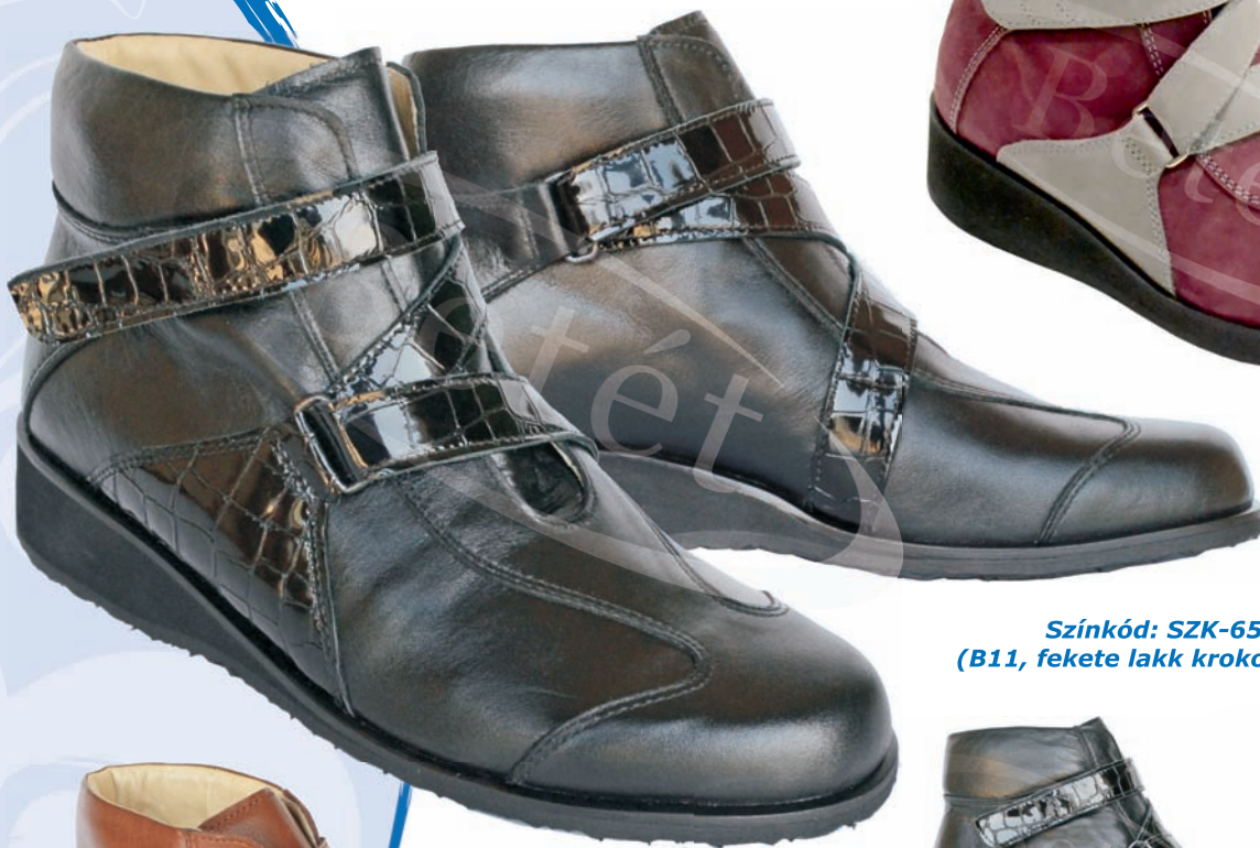
Színkód: SZK-654 (B11, fekete lakk kroko)