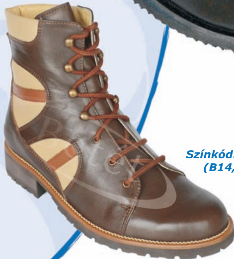
Színkód: SZK-658 (B14, B5, B13)