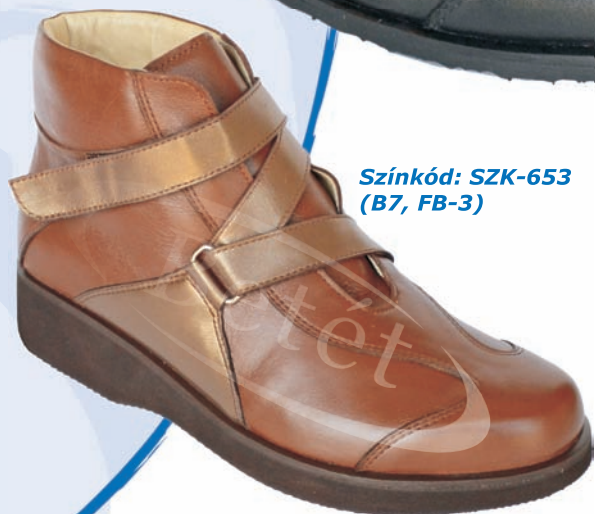
Színkód: SZK-653 (B7, FB-3)