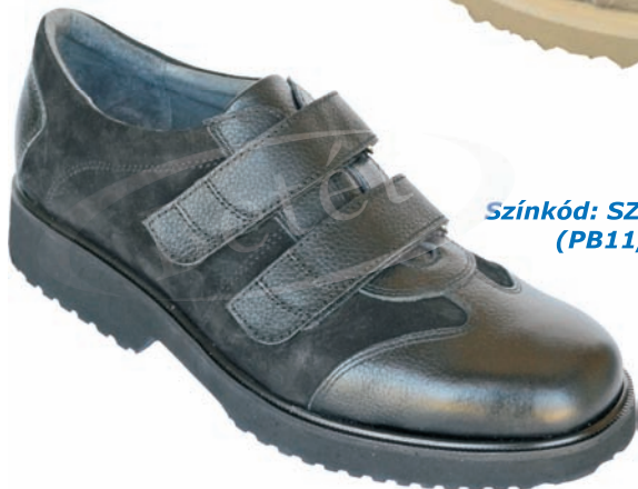
Színkód: SZK-636 (PB11, N15)

Sportos két tépőzár pántos uniszex félcipő rejtett szivacsállal.