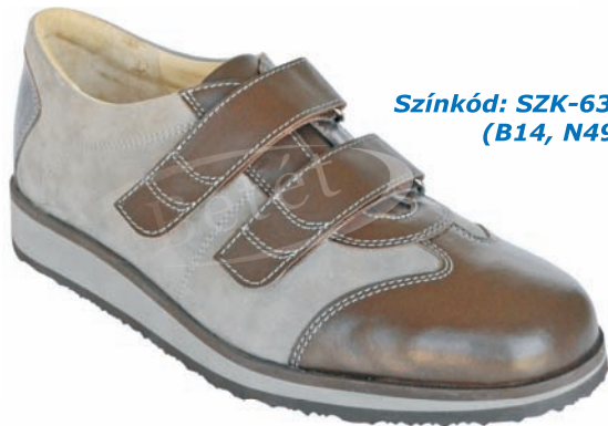
Színkód: SZK-635 (B14, N49)