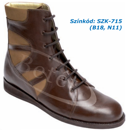
Színkód: SZK-715 (B18, N11)