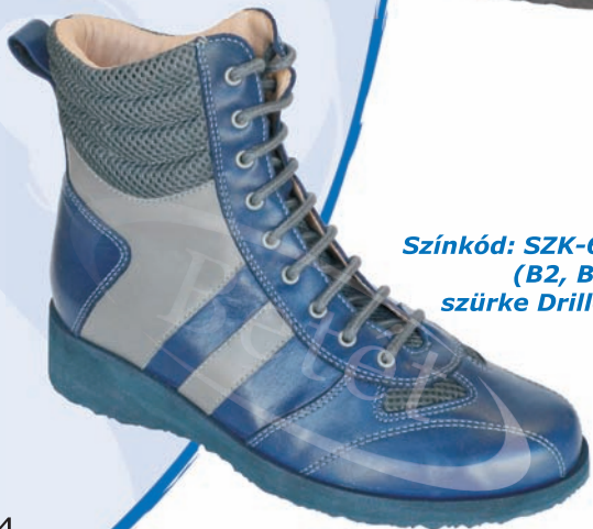
Színkód: SZK-648 (B2, B10, szürke Drilllex)