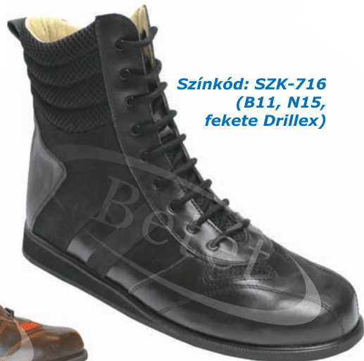
Színkód: SZK-716 (B11, N15, fekete Drilllex)